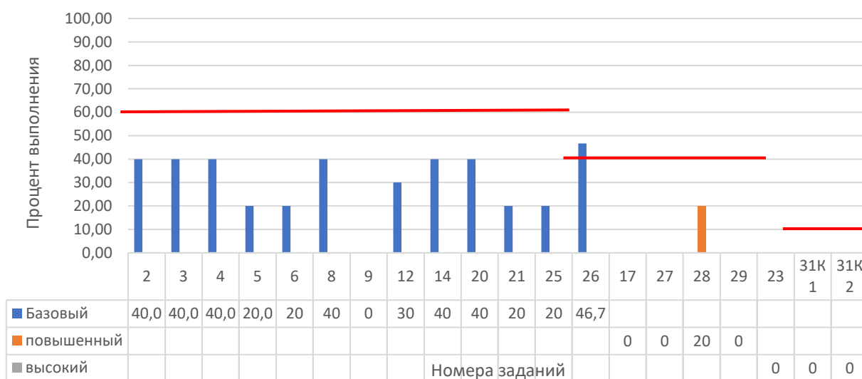
Рисунок 2. Задания, по которым участники не преодолели минимальный порог

На рисунке 2 представлены данные по заданиям (%), уровень выполнения которых не преодолел минимальный порог. Красной линией отражен минимальный порог выполнения для каждого уровня сложности: базовый – 60%, повышенный – 40%, высокий – 10%.